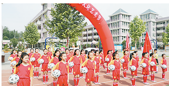
足球文化节上,同学们表演足球操舞。

据了解,集英小学极为重视校园足球工作,每天的阳光大课间活动就是以足球为主题,该校还是国家级青少年校园足球示范校。据介绍,接下来的足球文化节活动中,该校将组织同学参加班级足球联赛和足球课余游戏,让足球伴随同学们的快乐童年,把校园足球打造成为集英小学的另一张出彩名片。